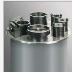
Trumpf oder Amada Matrizenaufnahmen Trumpf or Amada die holders