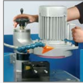
einfache Handhabung / userfriendly handling