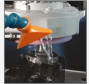
Wasserkühlung / water cooling