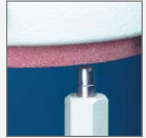
Abrichte Diamant / true diamond