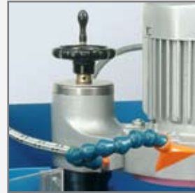
Höhenverstellung / vertical adjustment